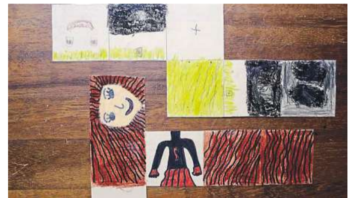
Povrch krychle Některé děti lépe dojdou k postupu výpočtu povrchu krychle díky zkušenosti s „šitím šatů“ pro panenku na rozložené krychli.