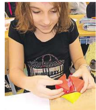
Spojte Další možností, jak získávat dovednosti týkající se povrchů geometrických útvarů, je spojování těles.